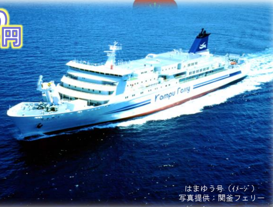
はまゆう号 (イメージ)