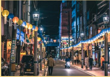
ニシタチ(イメージ)

ニシタチ 宮崎市の中心部にある「西橋通り」を中心に、中央通り、恵比寿通り、高松通り、西銀座通りなどを含めた一帯を通称「ニシタチ」と呼ばれています。宮崎県最大の歓楽街で、約1,100軒の飲食店が立ち並びます。