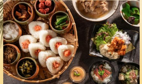
食事一例(イメージ)