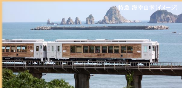
特急 海幸山幸 (イメージ)