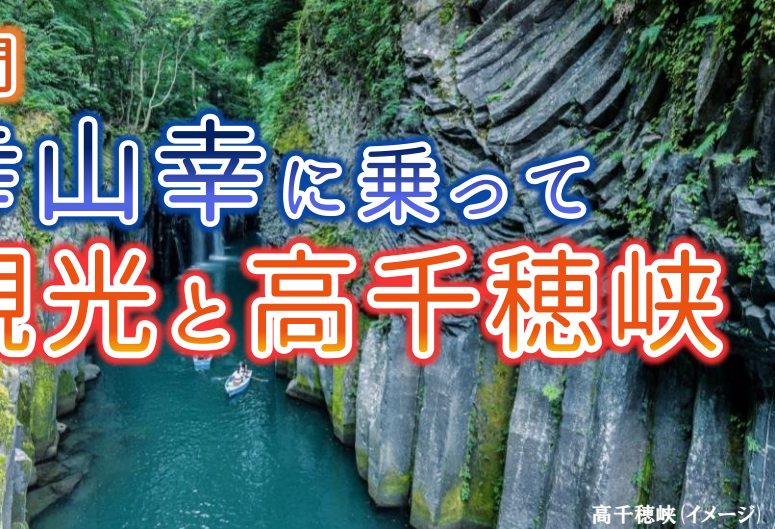
高千穂峡 (イメージ)