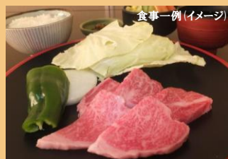
食事一例 (イメージ)