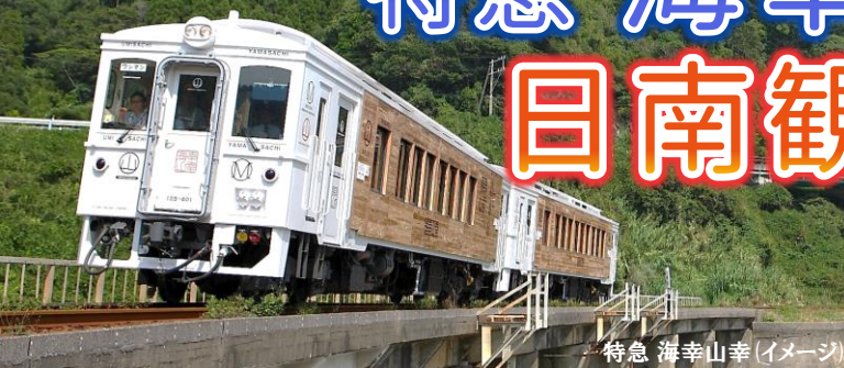
特急 海幸山幸 (イメージ)