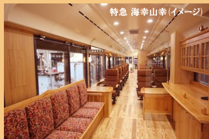
特急 海幸山幸 (イメージ)

うみさちやまさち 特急 海幸山幸 「木のおもちゃ箱のようなリゾート列車」をコンセプトに、車内には沿線の「飫肥杉おびすぎ」がたっぷり使われています