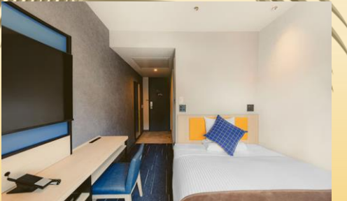
スタンダードダブル(イメージ)