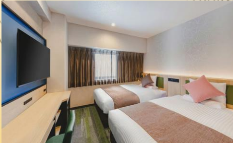
スタンダードツイン(イメージ)