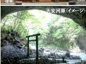
天安河原 (イメージ)

あまのいわとじんじゃ・あまのやすかわら 天岩戸神社・天安河原 天照大神がお隠れになられた天岩戸を御神体としてお祀りしている天岩戸神社と、天照大神がお隠れになったさい、八百万の神がこの河原に集まり神議されたと伝えられる大洞窟、天安河原を観光ガイドがご案内致します。 ※天安河原は天岩戸神社から徒歩約10分