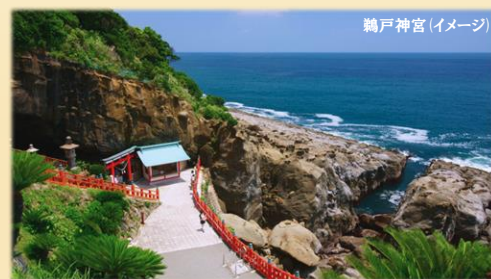
鵜戸神宮 (イメージ)