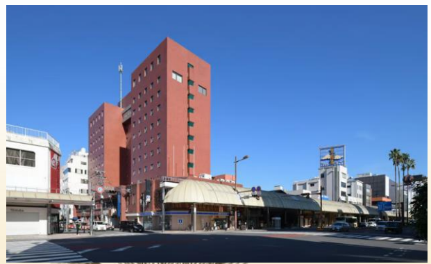
ホテル外観(イメージ)

客室は2024年夏リニューアル! 宮崎市最大の繁華街「ニシタチ」に位置するマイステイズ宮崎。朝食には冷や汁やチキン南蛮など宮崎の郷土料理をはじめ、40種類以上のメニューを揃えています。