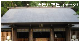
天岩戸神社 (イメージ)

高千穂峡 たかほぎょう 国の名勝天然記念物に指定された、日本を代表する景勝地の一つ。日本の滝100選に選定されている真名井の滝をはじめ、柱状節理が形作る独特の渓谷美で有名。