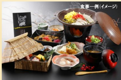
食事一例 (イメージ)

あまのいわとじんじゃ・あまのやすかわら 天岩戸神社・天安河原 天照大神がお隠れになられた天岩戸を御神体としてお祀りしている天岩戸神社と、天照大神がお隠れになったさい、八百万の神がこの河原に集まり神議されたと伝えられる大洞窟、天安河原を観光ガイドがご案内致します。 ※天安河原は天岩戸神社から徒歩約10分