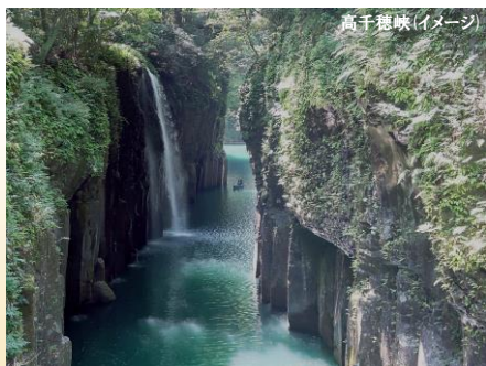
高千穂峡 (イメージ)

高千穂峡 たかほぎょう 国の名勝天然記念物に指定された、日本を代表する景勝地の一つ。日本の滝100選に選定されている真名井の滝をはじめ、柱状節理が形作る独特の渓谷美で有名。