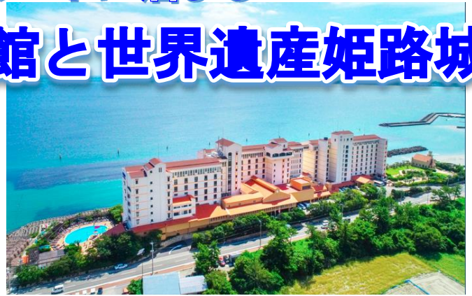
アオアヲナルトリゾート

鳴門海峡と淡路島を見渡すオーシャンフロントのリゾートホテルで、鳴門の海が一望できる温泉&夕食は阿波山海の美味が勢ぞろいしたバイキングをご賞味♪ 倉敷美観地区と大塚国際美術館、世界遺産の姫路城をご見学いただく、見どころ盛りだくさんの2日間!