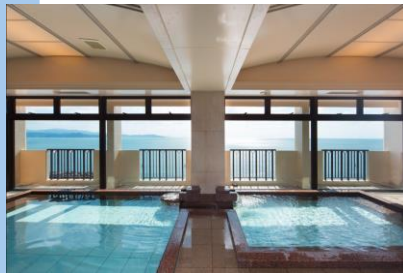
大浴場(8階展望風呂)

客室は全206室。屋は太陽にきらめく海を眺めながら、夜は打ち寄せる波に耳を傾けながらゆったりとした時の流れをご満喫ください。