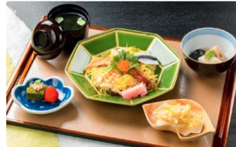
祭り寿司、天ぷら、野菜の煮物、吸い物、水物 (料理イメージ)