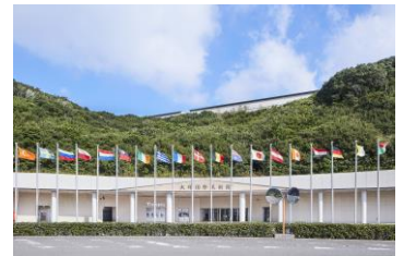
正面エントランス

大塚国際美術館: 大塚グループが設立した日本最大級の常設展示スペースを有する「陶板名画美術館」。館内には、古代壁画から現代絵画まで、世界26カ国190余の美術館が所蔵する約1,000点の西洋の名画が、特殊技術によって陶板で原寸大に再現されています。約4kmに及ぶ鑑賞ルートには、古代遺跡や礼拝堂などの壁画を現地の空間そのままに再現した環境展示や、ミケランジェロ、レオナルド・ダ・ヴィンチ、モネ、ゴッホ、ピカソなどの名画の美術史の変遷に沿って展示した系統展示、時代を超えて古今の画家たちの描いた代表的な作品を展示したテーマ展示もあり、日本に居ながらにして世界の美術館が体験できます。