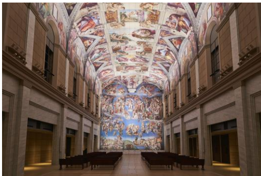
システィナ・ホール