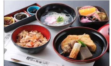
先附(しらすのくぎ煮など)、名物姫路おでん、煮物、汁物、ご飯物、デザート (料理イメージ)